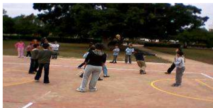
2 ème Cours : handball avec les CE5