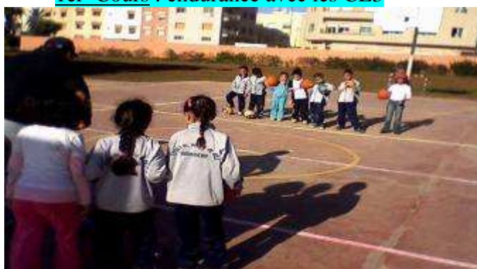
3 ème Cours : jeu collectif avec ballons avec les CE3