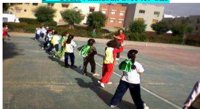
4 ème Cours : course de poursuite avec les CE2