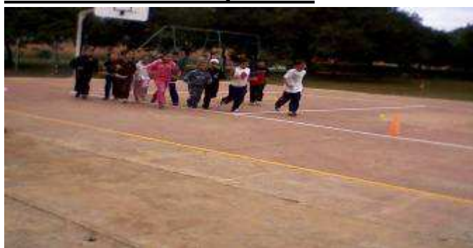
1 er Cours : endurance avec les CE3